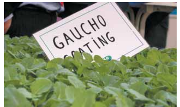
Verdachte: neonicotinoïdehoudend middel Gaicho.

"Helaas zijn de dossiers waarin die experimenten en de uitkomsten staan beschreven niet openbaar. Die liggen bij het Ctgb. Dat is onder meer omdat de aanvragers, zoals Syngenta en Bayer, geen kennis gratis willen weggeven aan hun concurrenten. Het Ctgb publiceert alleen de samenvattingen in hun onderbouwingsbesluiten."