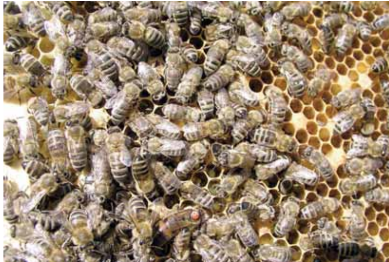
Slaachtoffer: honingbijen.

cho , Cruiser , Actara en Poncho en worden gebruikt op appel, peer, kasvruchtgroenten, sla, prei, koolsoorten, mais, erwt, aardappel, biet, braam, zwarte bes, aalbes en framboos, maar ook op het gras van sportvelden en golfterreinen en in openbaar groen.